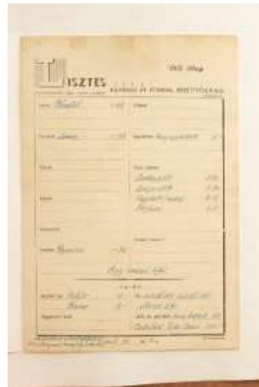
5. A Berettyóújfalui Kerületi Ipartestület alapszabályai. Adler József könyvnyomdájában készült 1933-ban. Leltári szám: IV.2002.17.