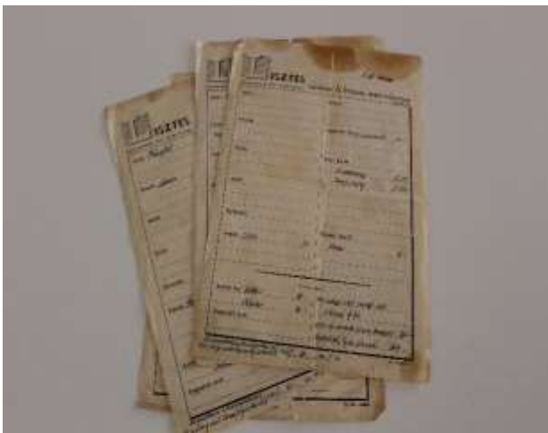
4. A Lisztes Kávéház és Étterem étlapjai, 4 darab. Leltári szám: IV.2002.19.1-4.