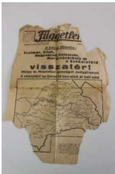
12. A " Függetlenség " 1940.VIII.31.-i számának címlapja , cikk, térkép a 2. bécsi döntésről Leltári szám: IV.91.154.