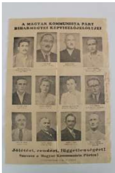
10. A Magyar Kommunista Párt biharmegyei képviselőjelöltjei. Készült a Szabadság-nyomdában Debrecenben. Leltári szám: IV.2016.77.