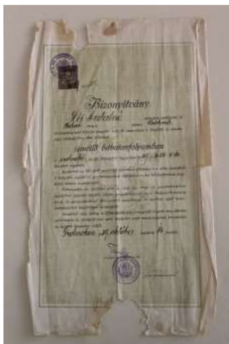
14. Bábaképezdei bizonyítvány Híj Antalné csökmői lakos részére, 1909. Leltári szám: IV.91.8.