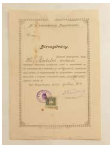
17. Szülésznő esküje, Kádár Dánielné, 20. század eleje. Leltári szám: IV.91.10.