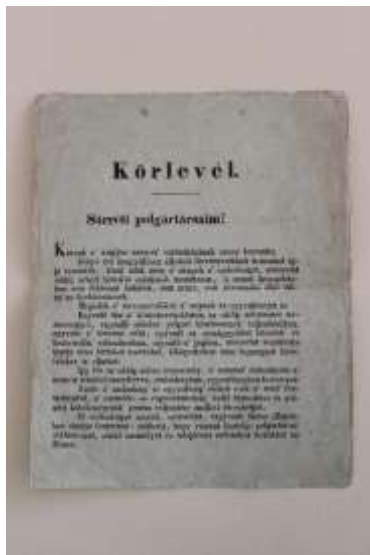
2. Miskolczy Károly főszolgabíró nyomtatott körlevele "Sárréti polgártársaim" B.újfalú, 1848. ápr. 26. Leltári szám: IV.75.367.