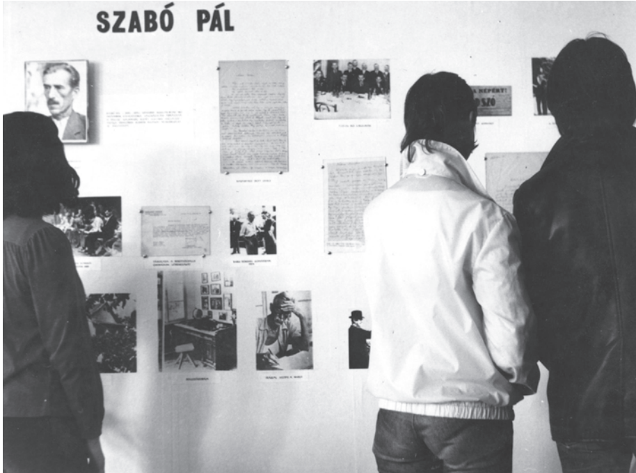
3. kép. Szabó Pál-kiállítás a Bihari Múzeumban