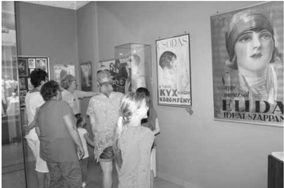
5. kép. Családi múzeumi délután A szépség és a reklám c. kiállításban 2018