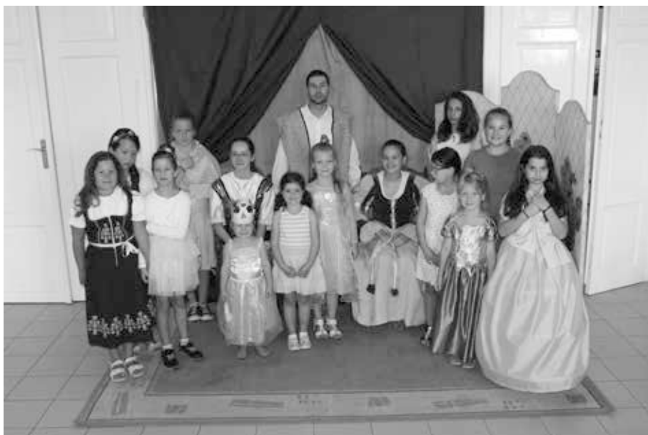
13. kép. A barokk tábor résztvevői, 2017