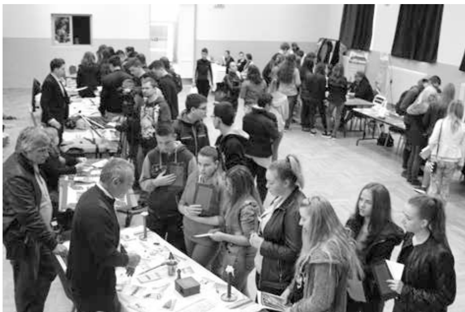
12. kép. IKSZ-börze, 2017