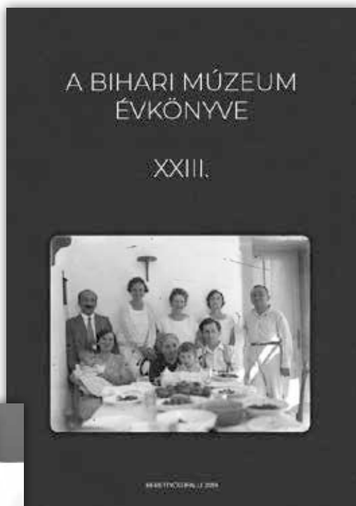
2. kép. A Bihari Múzeum Évkönyve, XXIII. címlapja