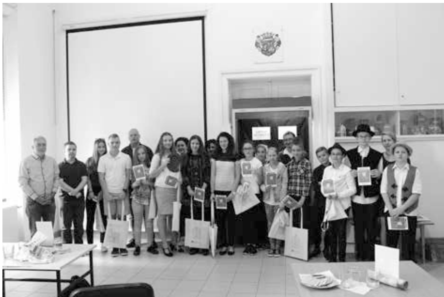
8. kép. Az általános iskolás vetélkedő résztvevői, 2018