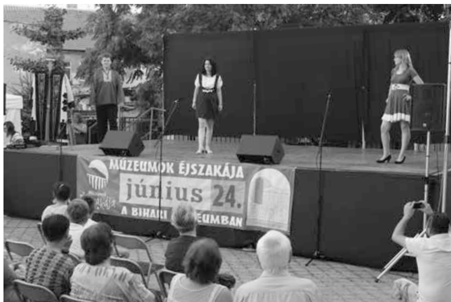
10. kép. Divatbemutató a Múzeumok éjszakáján, 2017-ben