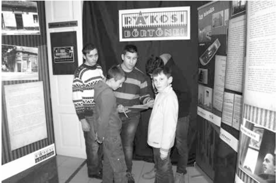
4. kép. „Nyomozós” családi délután a Rákosi börtönei c. kiállításban