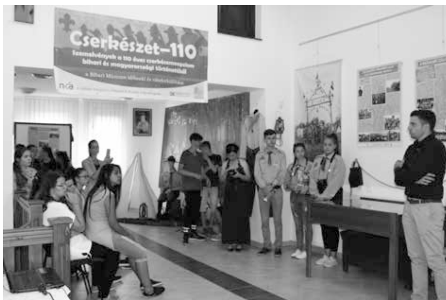
7. kép. Cserkészzet 110 – Szemelvények a 110 éves cserkészmozgalom történetéből c. vándorkiállítás megnyitója Létavértesen, a Rozsnyai Gyűjteményben 2018. május 11-én