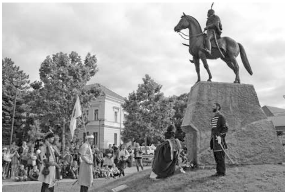
14. kép. Kádár vitéz-emléknap, 2017