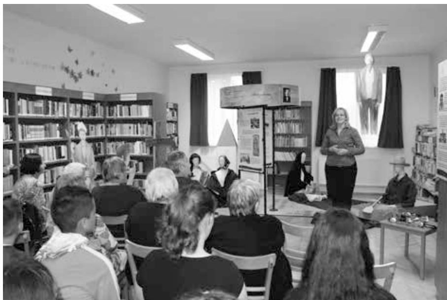
6. kép. „Gyertek elő, szép regém van” – Arany János balladaköltészete c. kiállítás a furta könyvtárban 2018 szeptemberében