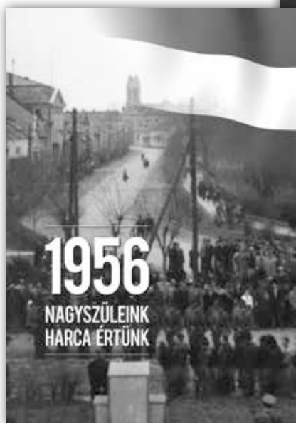
3. kép. 1956 – Nagyszüleink harca értünk c. kötet címlapja