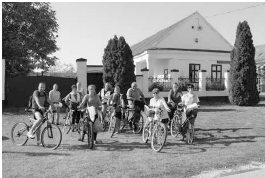
11. kép. Kerékpártúra a Múzeumok Őszi Fesztiválja keretében, 2018