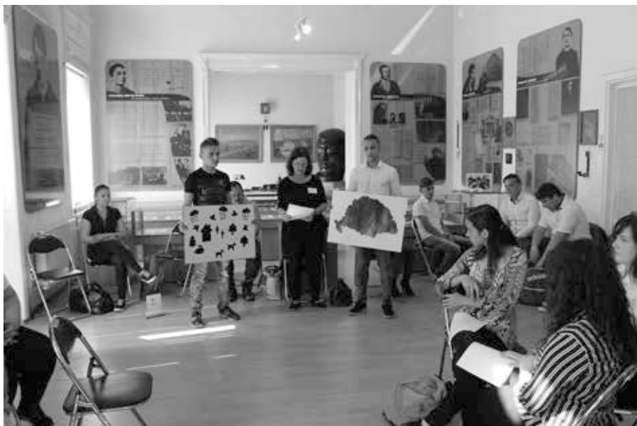
9. kép. Vetélkedő a Holnap c. irodalmi antológia költőiről a nagyváradí Ady Múzeumban