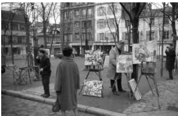
19. kép. Párizs (Gy. N. 858/31.3.)

megettévesztés! Csak amikor a képüket felismertük, akkor kezdtünk gyanakodni valami aljas trükkre.