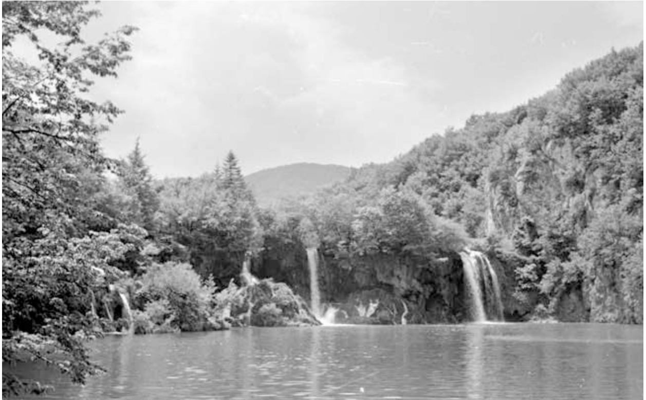
31. kép. Jugoszlávia, Plitvicei Nemzeti Park (Gy. N. 858/17.17.)