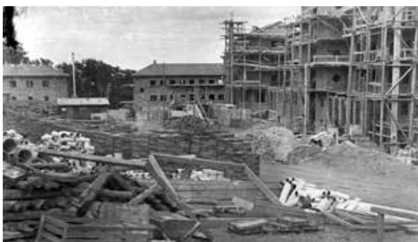
11. kép. Galyatető, a szálló építése (Gy. N. 879/14.)