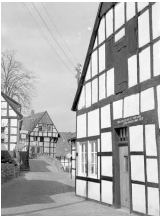
27. kép. NSZK, Tecklenburg, 1979 (Gy. N. 858/48.18.)

Zemplén, László-tanya–Sárospatak: 2 kocka 6x6 cm-es fekete-fehér rollfilmből (Gy. N. 895/12) és 1 kocka 6x6 cm-es színes rollfilmből (Gy. N. 897/10.)