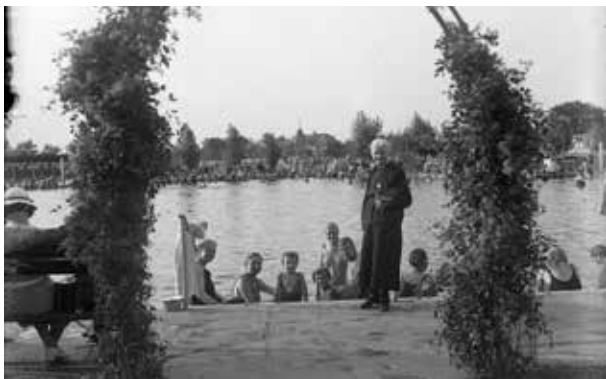
10. kép. A Barcsay család a hajdúszoboszlói gyógyfürdőben (Gy. N. 870/6.)