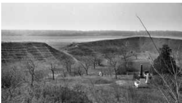
17. kép. Szabolcs, Földvár (Gy. N. 881/16.22.)