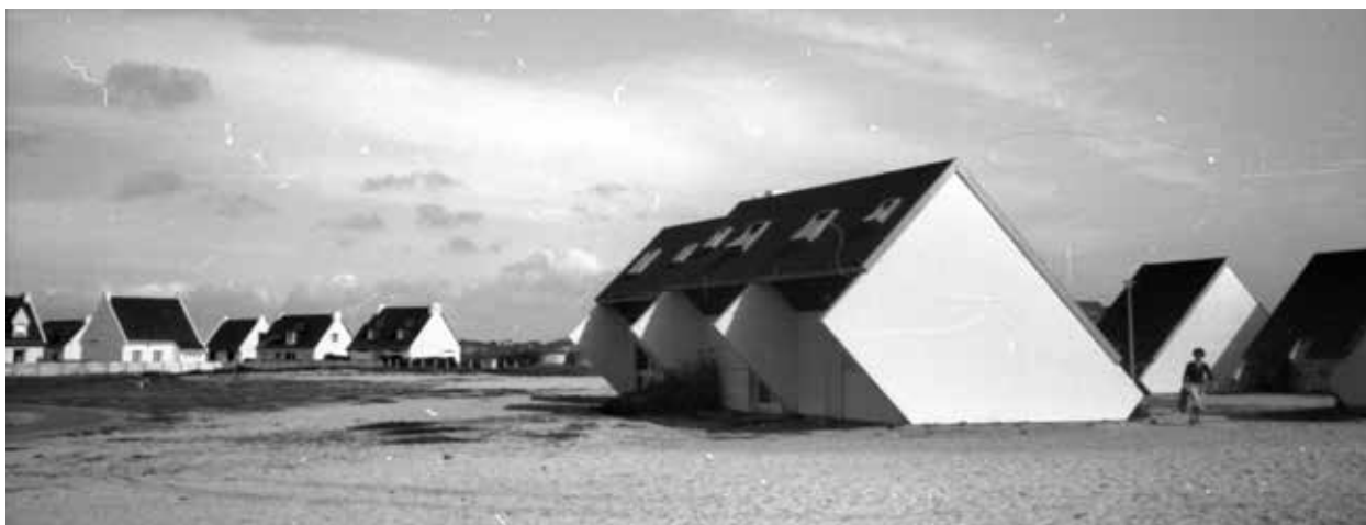
30. kép. La Baule (Gy. N. 858/56.35.)