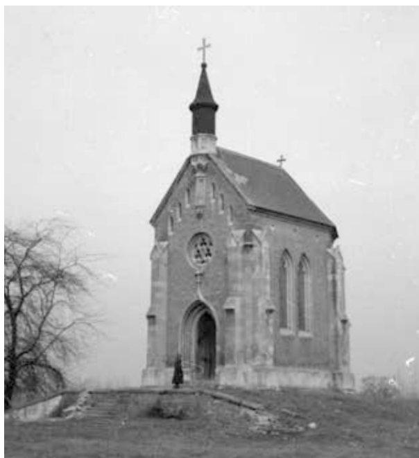
29. kép. Lórév, Zichy-kápolna (Gy. N. 881/14.7.)