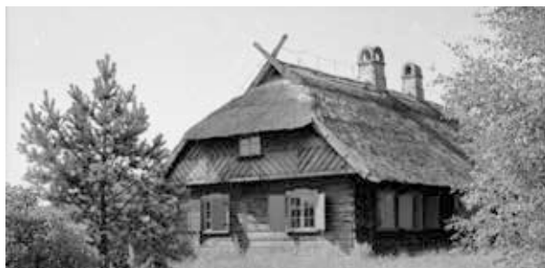
24. kép. Sanok, Skanzen (Gy. N. 858/2.22.)