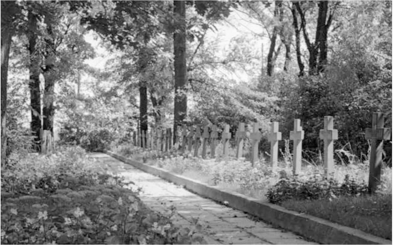
33. kép. Lengyelország, Lukow, I. világháborús hősi temető, 1975 (Gy. N. 858/2.16.)