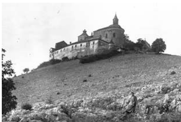
9. kép. Krasznahorka vára (Gy. N. 878/26.)