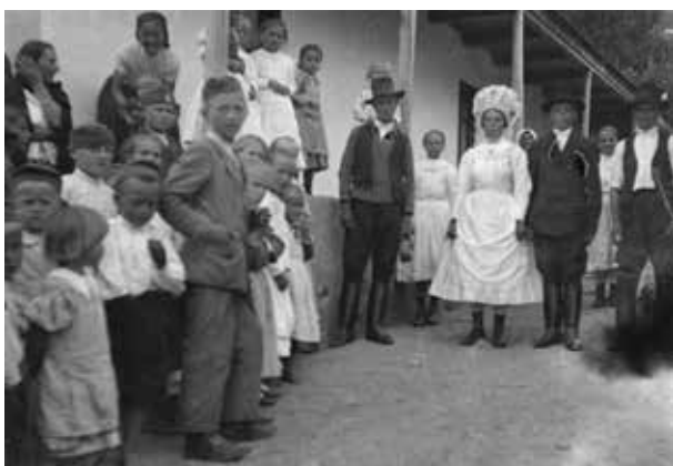
12. kép. Felsőhuta, csoportkép (Gy. N. 879/16.)