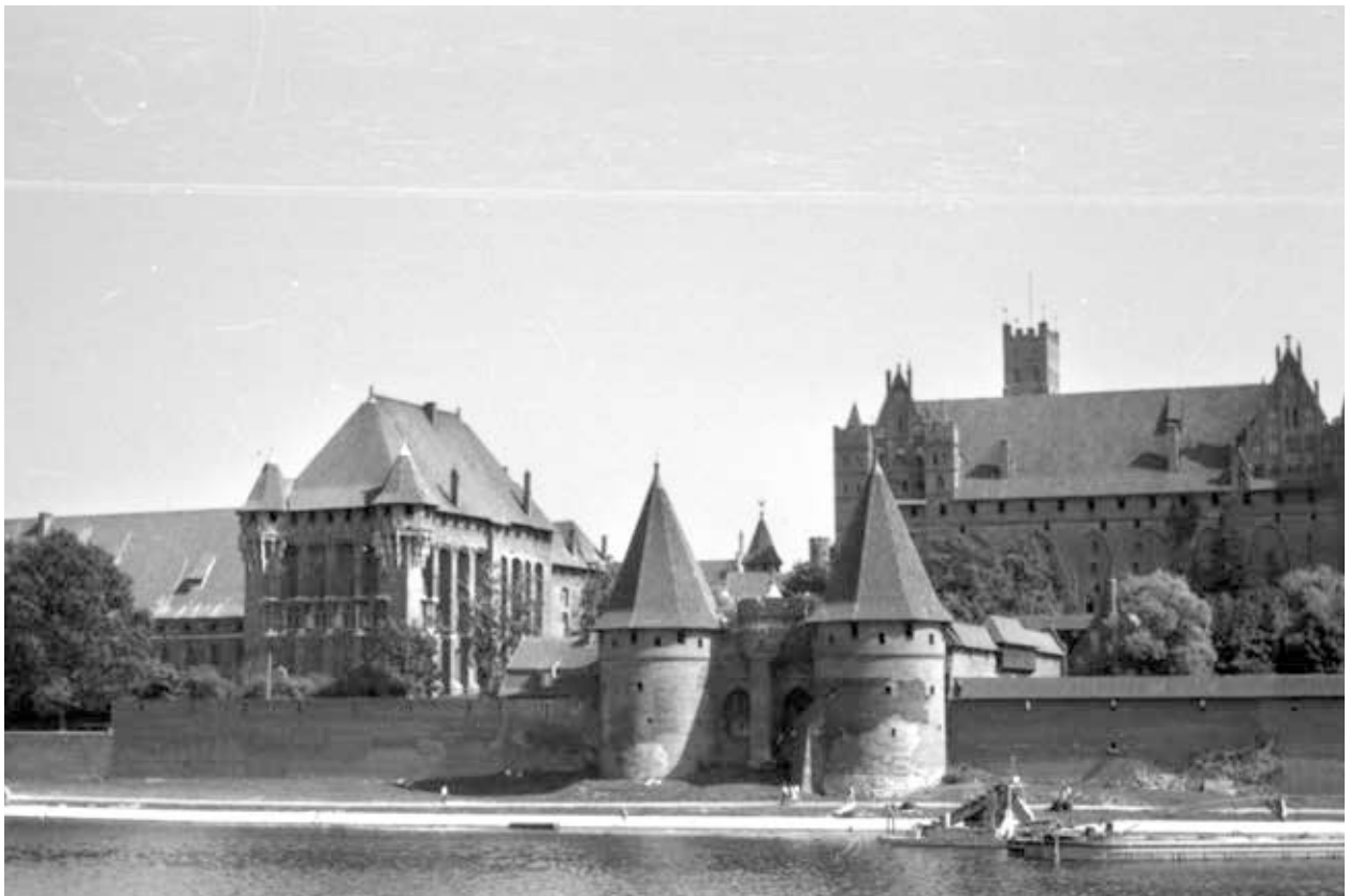
32. kép. Lengyelország, malborki vár (Gy. N. 858/3.40.)