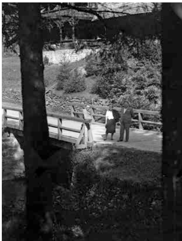
15. kép. Kárpátalja, Rónafüred (Gy. N. 878/31.)