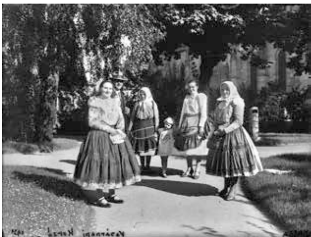
6. kép. Kassa, vasárnapi korzó népviseletben (Gy. N. 871/1.)