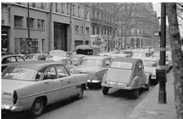
18. kép. Párizs, társasutazás (Gy. N. 858/33.17.)