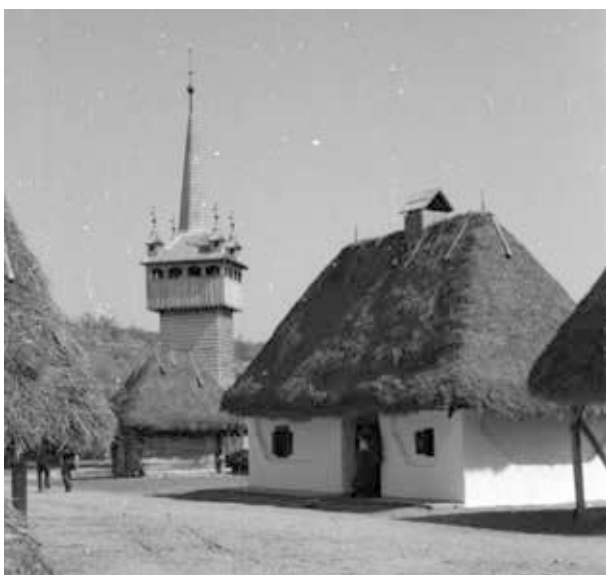
22. kép. Szentendre, Skanzen (Gy. N. 881/24.6.)

Erdély, Nagyenyed–Magyarbagó–Segesvár: 1 db színes 24x36 mm-es normál kisfilmtekercs, 14 kocka (Gy. N. 858/23.)