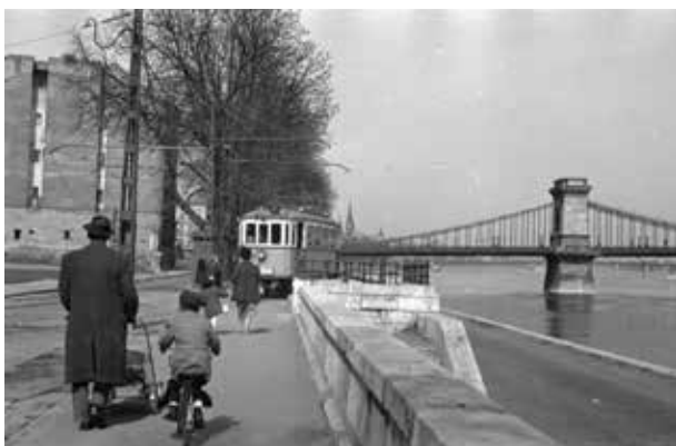
16. kép. Budapest (Gy. N. 881/81.28.)