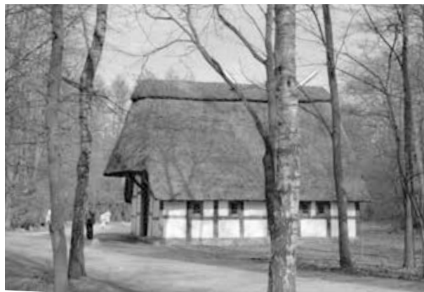
28. kép. Cloppenburg, Múzeumfalu, 1979 (Gy. N. 858/49.12.)

Bízom benne, hogy a tanulmány felkeltette az érdeklődést, s így teljesítjük az adományozó Barcsay család szándékát: fotóik értékes adalékkal szolgálnak a XX. század hiteles megismeréséhez.