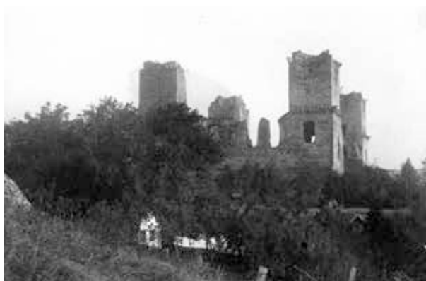
7. kép. Diósgyőri vár (Gy. N. 874/11.)

Felvidék: Kassa–Sztracena-völgy–Krasznahorka–Tátra-Lomnic–Csorba-tó: 9 db síkfilm, 9 db 6x9 cm-es üveglemez (GY. N. 878/17–33.) (9. kép)