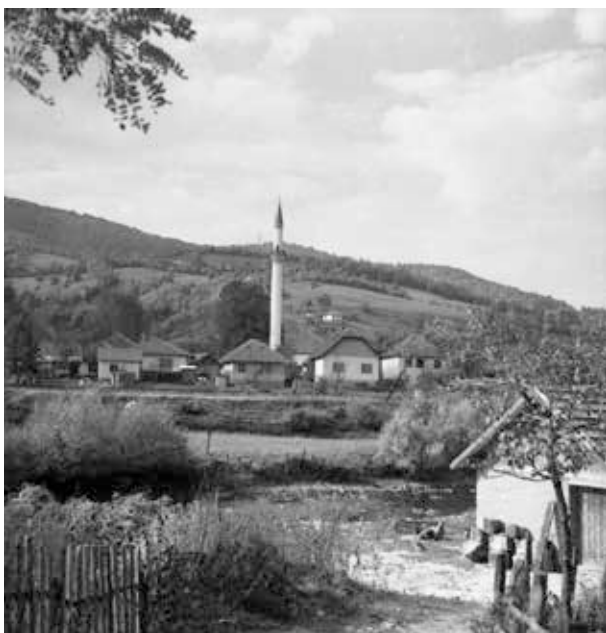
21. kép. Bosznia-Hercegovina, vidéki táj (Gy. N. 900/2.)