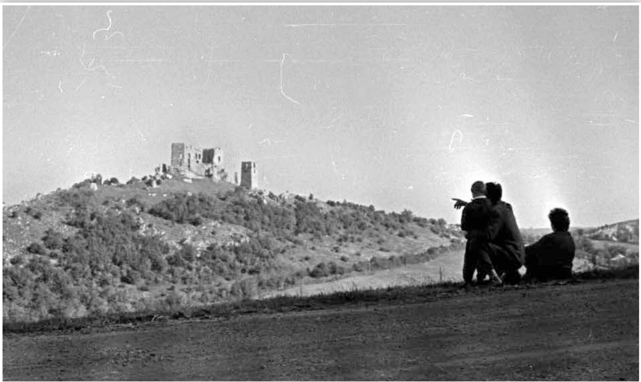
A cseszneki vár (Gy. N. 881/44.9.)