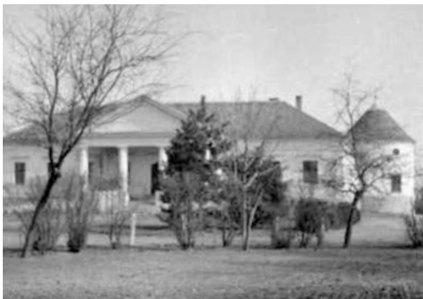
20. kép. Nagykereki, Bocskai-várkastély (Gy. N. 901/6.)