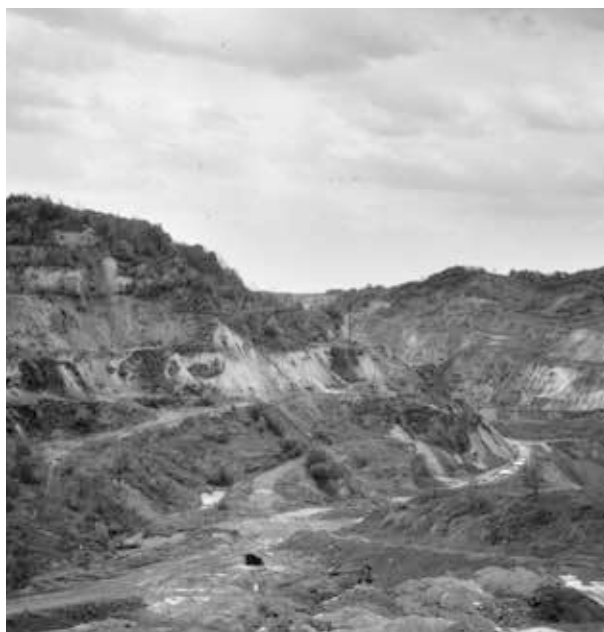
1. kép. A rudabányai ősemberlelet környéke (GY. N. 904/8.)