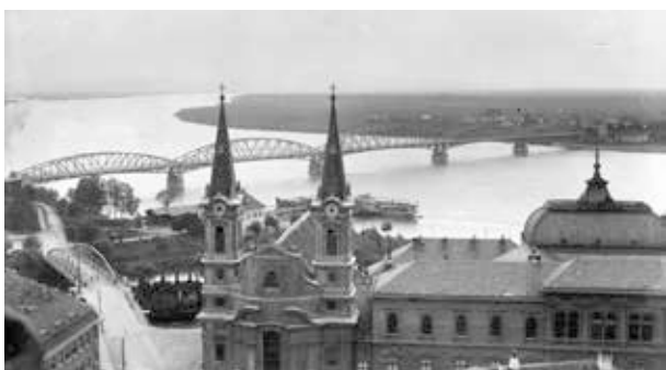
4. kép. Esztergom, Mária Valéria híd a Bazilikától (Gy. N. 874/16.)