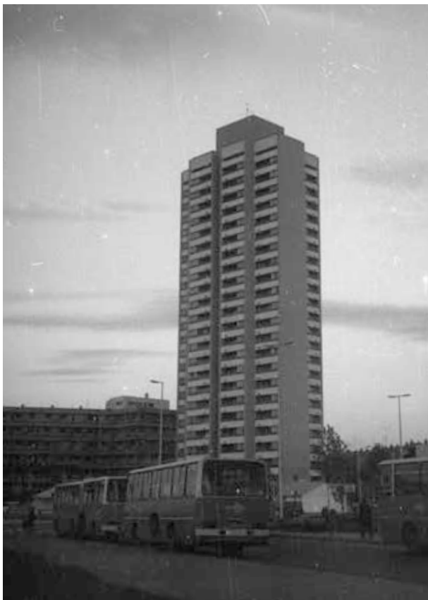
26. kép. Szolnok, toronyház (Gy. N. 896/7.)