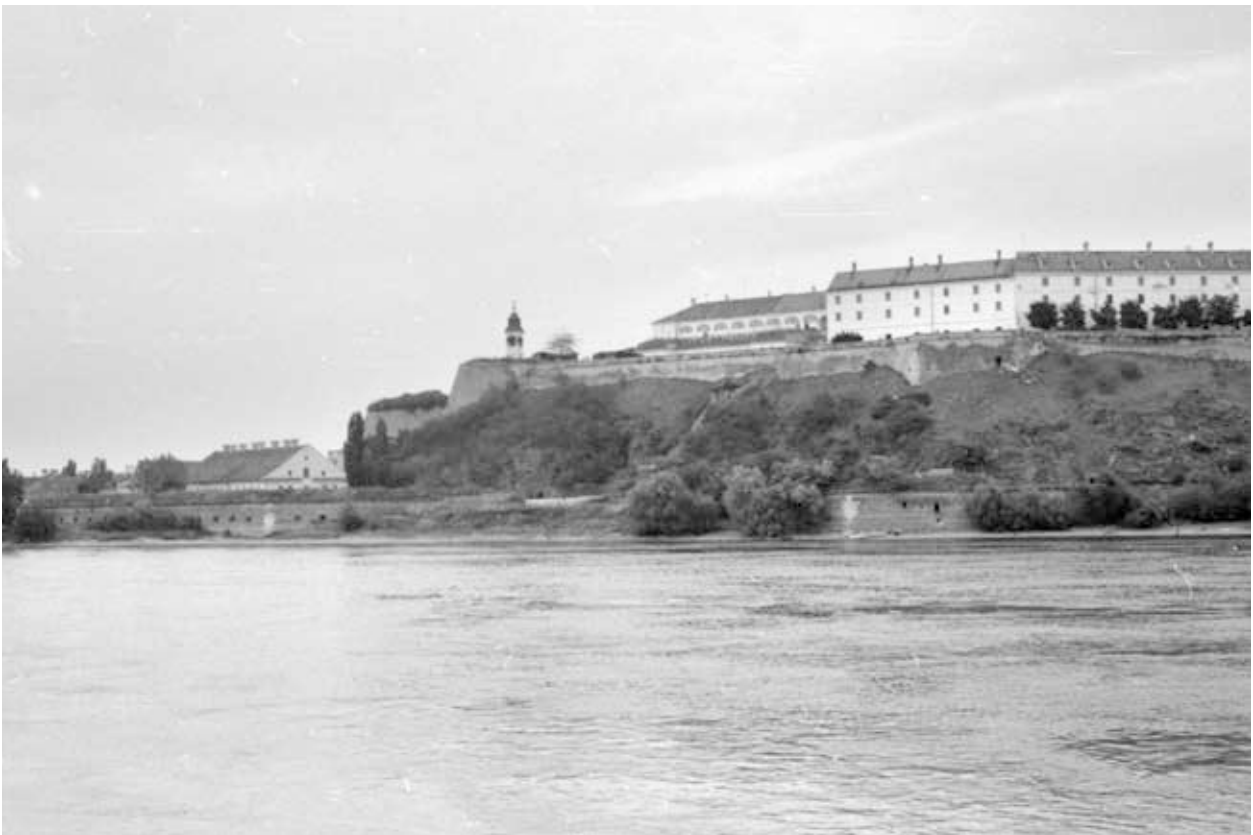
34. kép. Délvidék, Pétervárad, 1977 (Gy. N. 858/9.34.)