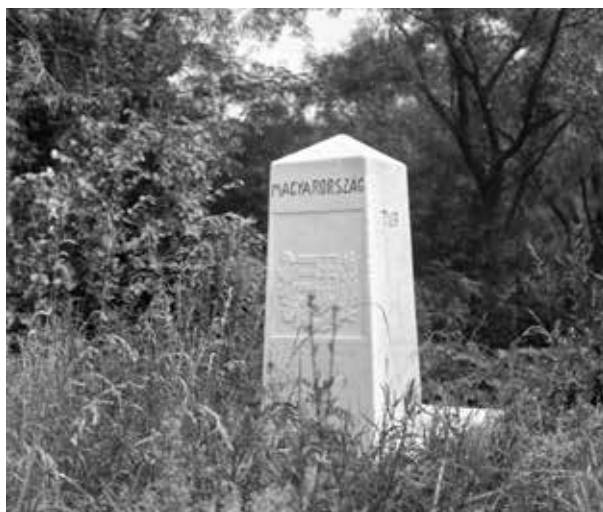
25. kép. Magyar–román–szovjet határkő (Gy. N. 895/10.)