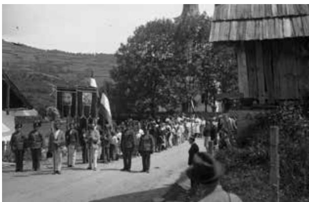
13. kép. Kárpátalja, bevonulás fogadása (Gy. N. 871/20.)