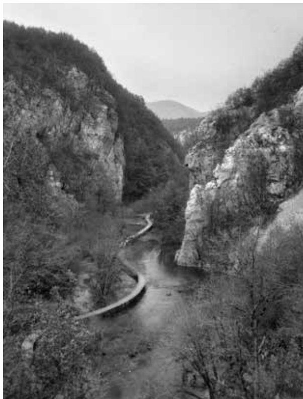
23. kép. Jugoszlávia, Plitvicei Nemzeti Park (Gy. N. 858/17.39.)