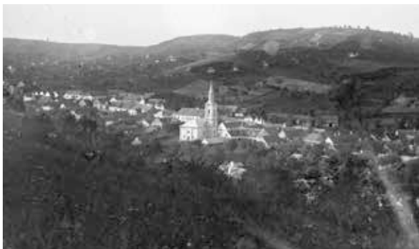
3. kép. Szekszárd, városkép (Gy. N. 876/6.)